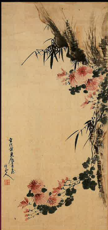
「懸崖菊」武市瑞山 筆