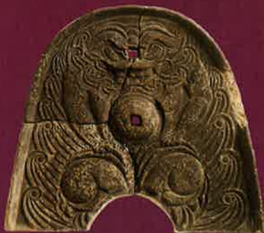
奈良県奈良市 史跡 中山瓦窯跡 鬼瓦 奈良文化財研究所蔵