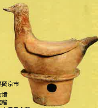
京都府長岡京市 いびのやま 恵解山古墳 水鳥形埴輪 京都府教育委員会蔵