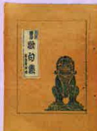
「労働歌謡集」 (國澤直正氏寄贈)

昭和20年(1945)8月15日に終戦を迎えた日本では各地で復興が進められました。ところが、翌21年12月21日に発生した昭和南海地震により、高知県は戦災に加え、さらなる被害を受けました。昭和南海地震の発生から70年にあたる本年。戦災・震災から復興にいたるまでの軌跡を初公開資料とともに紹介します。