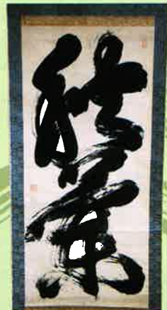
山内豊範二字書「秋蘭」