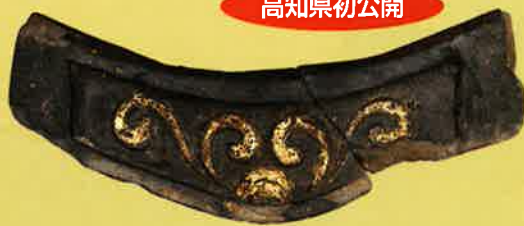
京都府京都市 伏見城跡 金箔瓦 京都市文化市民局文化芸術都市推進室蔵

文化庁主催、22回目の巡回展。国内では毎年8千件近い発掘調査が実施されています。近年、全国的に注目を集めた埋蔵文化財の展示を行い、文献では知ることのできない地域固有の歴史や文化を紹介します。災害に見舞われた遺跡の特集展示もあわせて、また、高知会場の地域展「田村遺跡群の青銅器」も同時開催します。中四国地域では、高知でのみ開催です。話題の資料を見ることができ、またとない機会です。