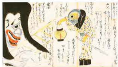
土佐お化け草紙 (複製) 原資料は堀見忠司氏蔵