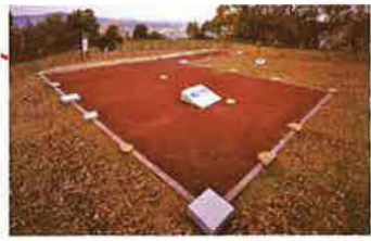
岡豊城跡跡 礎石建物跡復元