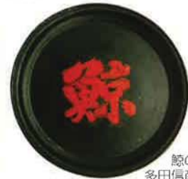
鯨の大杯 多田信彦氏蔵