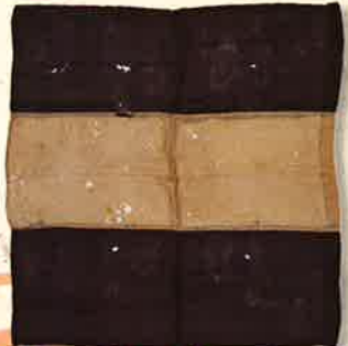
土佐藩指揮官の手旗 妙國寺蔵