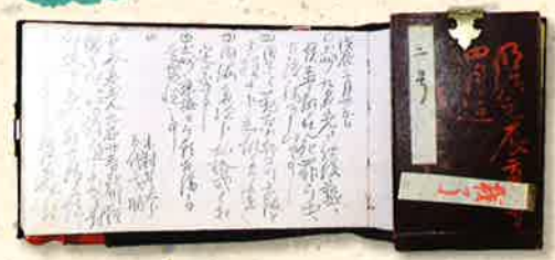
「御日記」(伊達宗城) 宇和島伊達文化保存会蔵