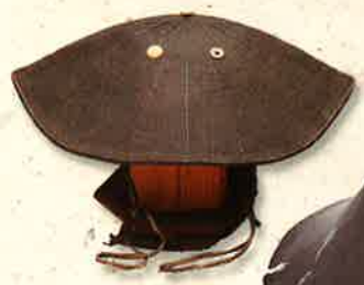
土佐藩指揮官の陣笠 妙國寺蔵